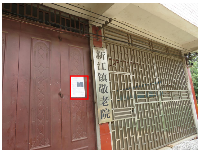
新江镇养老院公示照片

张贴区域选取的符合性分析：张贴在新江镇养老院、新江镇政府等信息公示栏比较显眼和易于接触的地方，使得广大群众更好了解本项目建设情况，符合公参办法要求。