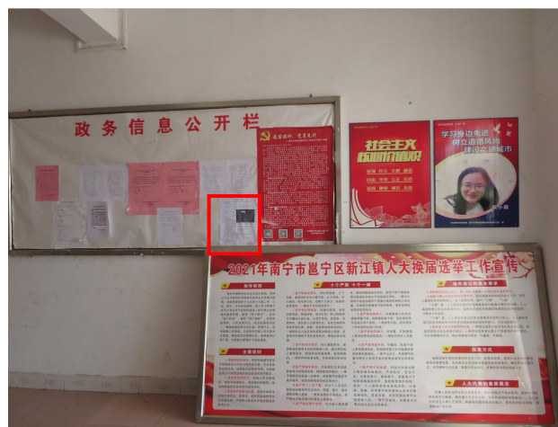
新江镇政府公示照片